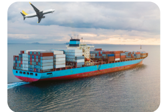
⑥ 커피 콩 수출하기