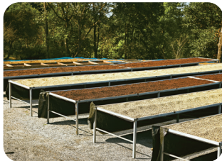
④ 커피 콩 건조하기