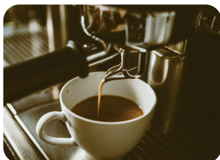
⑩ 커피 추출하기