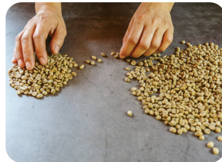
⑤ 커피 콩 가공하고 선별하기