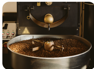
⑧ 커피 콩 로스팅(볶기)하기