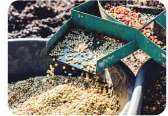
③ 커피 콩 세척하고 발효하기