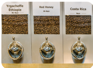
⑦ 커피 맛 감별하여 분류하기