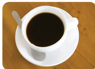
⑪ 커피 완성!