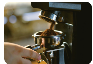
⑨ 커피 콩 분쇄하기