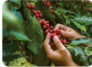
② 커피 콩 수확하기