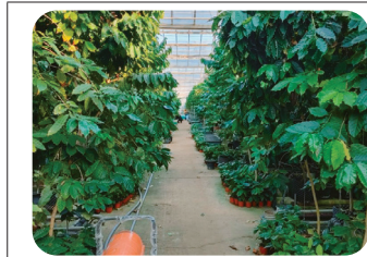
① 커피 씨앗 심고 기르기